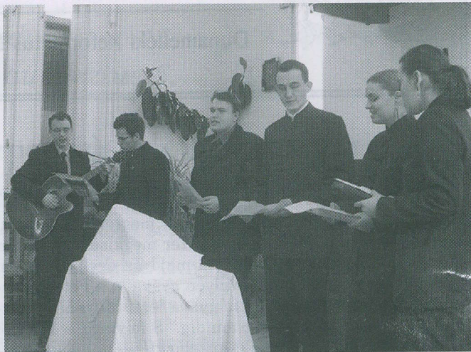
Teológusnap a Székelyföldön, Galambodon