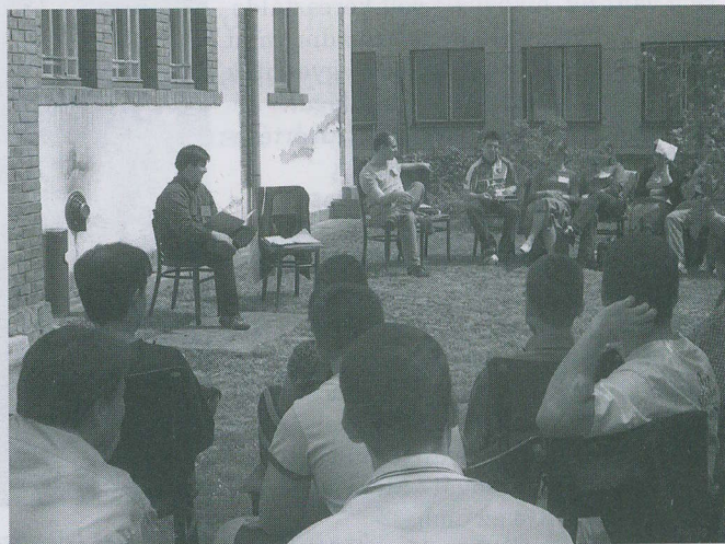
Teológusok szolgálnak a pécsi ifjúsági csendesnapon