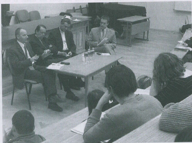
Három püspök egy jövő? c. beszélgetés az ELTÉn