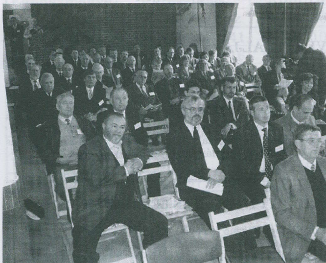
Közgyűlés a Pécsi Református Kollégiumban