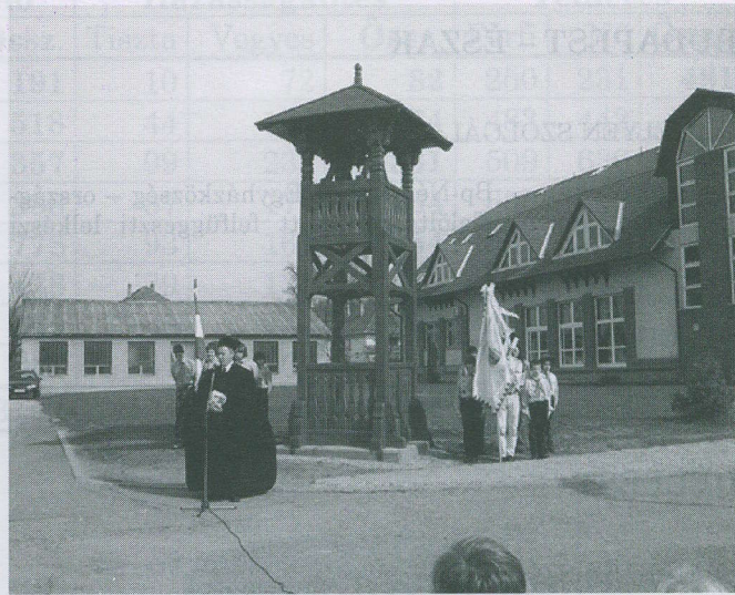
Az egyházkerületi közgyűlés áprilisi üdüdüét a Pécsi Református Kollégiumban tartotta. Az üdüdüvaron felállított haranglábat az üdüdü előtt szentelte fel Szabó István püdüdüpök.