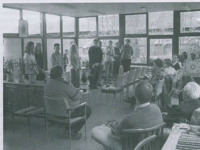
Teológusok látogatása a hollandiai magyar gyülekezeti központban, Vianenben